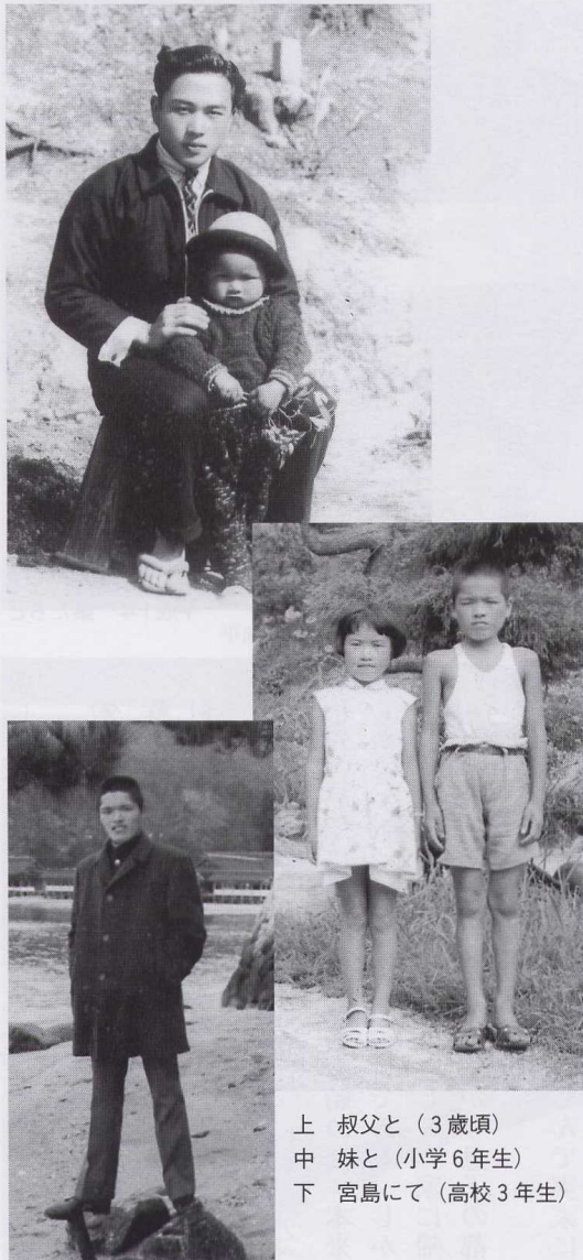
上 叔父と（3歳頃） 中 妹と（小学6年生） 下 宮島にて（高校3年生）